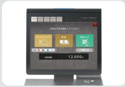
お支払い方法選択画面で「QRコード」を選択