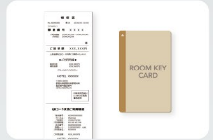
チェックイン機から発行される、領収書、ルームカードの受け取り