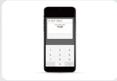
パスワードの入力