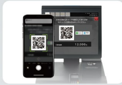
チェックイン機に表示されるQRコードの読み取り