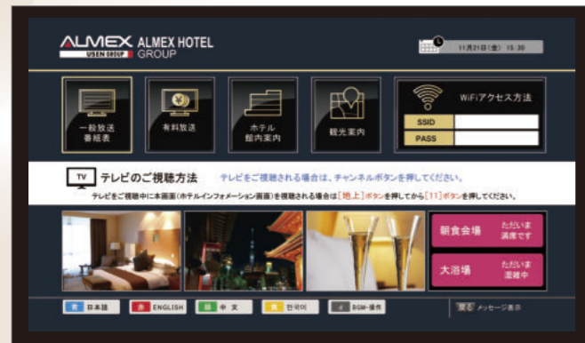
テンプレートA トップ画面イメージ