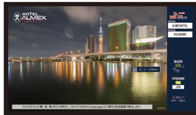
テンプレートB トップ画面イメージ

テンプレートAに比べ可動および編集領域を拡大しカンタンに オリジナル画面の作成ができます。季節やイベントに合わせた イメージ画像の挿入でWelcome画面を作成してみてください。